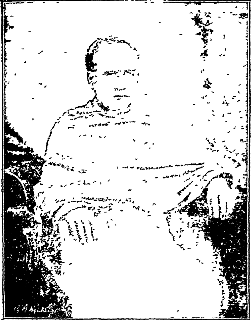
ईश्वरचन्द्र विद्यासागर ।